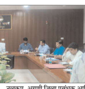
उद्यान अधिकारी, अधियंत्रिता सिंचाई, नलकूप, अग्रणी जिला प्रबंधक आदि लोग उपस्थित रहे। मुख्य विकास अधिकारी ने निर्देशित किया कि जनपद में सूखे की आशंका की दृष्टिगत संबंधित विभाग बीजों और सिंचाई की पर्याप्त व्यवस्था सुनिश्चित करें, धान की खेती के रकबे को कम किया जाए, कम अवधि की धान की फसल का चयन किया जाए। थान की सीधी बुवाई को प्राथमिकता दिया जाए, अरहर, उदर मूग का रकबा बढ़ाया जाए, नहर के टेल फीडिंग करें, कोई भी राजकीय और निजी नलकूप विद्युत या यांत्रिक दोष से प्रभावित न हो। उन्होंने पशुपालन विभाग को निर्देशित किया कि पशुओं के चार के लिए हरे चारे और भूसे को व्यवस्था सुनिश्चित करें।