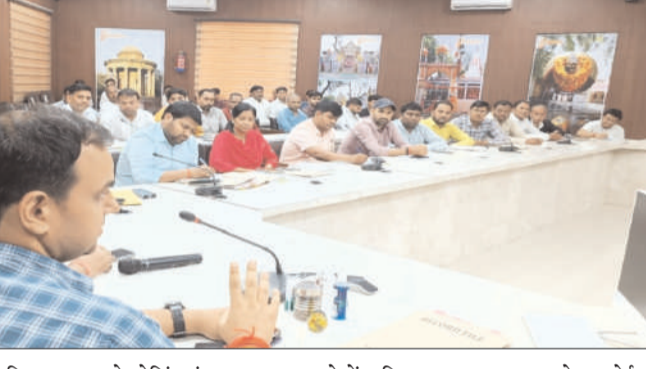
हॉस्टल एवं 100 से अधिक क्षमता वाले कोचिंग संस्थान को फायर डिपार्टमेंट से एनओसी/अग्नि सुरक्षा प्रमाण पत्र प्राप्त करने का निर्देश दिया। भवनों में अग्निशमन यंत्र, वॉटर हॉट्टर, स्मॉकलर सिस्टम एवं फायर अलार्म घण्टा अनिवार्य होगा। उन्होंने कहा कि सभी संस्थानों का विद्युत भार/लोड ऑडिट विद्युत विभाग से कराया जाए। ओवरलोडिंग, जर्जर वायरिंग, लूज कनेक्शन तत्काल ठीक कराए जाएं। प्रत्येक मंजिल पर एम सी बी लगाना अनिवार्य होगा। उन्होंने कहा कि प्रत्येक भवन में कम से कम दो स्वतंत्र निकास मार्ग/सीढ़ियां हों। निकास मार्ग पर कोई सामान, कुर्सी, साइकिल आदि न रखी जाए। छाहानिकासद्वारा के साइनबोर्ड रात में भी दिखने वाले लगाए जाएं। सभी कर्मचारियों, शिक्षकों एवं वार्डन को फायर एक्सटिंग्विशर चलाने का प्रशिक्षण दिया जाए। कोचिंग संस्थान हॉल की क्षमता से अधिक छात्र न बैठें।