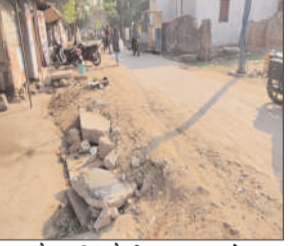
वैदुन, सिंगरौली, 25 जून (देवव्रत संवाद)। शहर के प्रमुख एवं व्यस्त मार्गों में शामिल डीएवी रोड मस्जिद मार्केट मार्ग इन दिनों बदहाल स्थिति में है। महज एक वर्ष पूर्व निर्मित सड़क गैस पाइपलाइन बिछाने के लिए को गई खुदाई के बाद पूरी तरह क्षतिग्रस्त हो गई है। स्थानीय नागरिकों का आरोप है कि संबंधित सचिवालय द्वारा कार्य अधूरा छोड़ दिया गया है, जिससे राहगीरों और स्कूली बच्चों को भारी परेशानी का सामना करना पड़ रहा है।

रोजाना देरी का सामना करना पड़ रहा है। नागरिकों का कहना है कि गैस पाइपलाइन बिछाने के बाद सड़क को पूर्व स्थिति में बहाल करना संबंधित ठेकेदार की जिम्मेदारी है, लेकिन अब तक केवल खानापूर्ति की गई है। सड़क के बीचों-बीच निकले सरिए और अधूरी मरम्मत के कारण आदिन लोग चौटिला हो रहे हैं तथा किसी बड़े हादसे की आशंका बनी हुई है। स्थानीय वाडवांसियों ने नगर निगम प्रशासन से मांग की है कि लापरवाह सचिवालय के खिलाफ कड़ी कार्रवाई की जाए और मार्ग का तत्काल मरम्मत कार्य कराया जाए। उनका कहना है कि निर्माण कार्य पूर्ण होने के बाद भी सड़क पर गड्ढे और मलबा छोड़ देना गंभीर लापरवाही है।