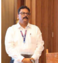
आजमगढ़, 15 जून (देवव्रत संवाद)। भारतीय स्टेट बैंक (एसबीआई) की ओर से सोमवार को कृषि विकास और शिक्षा को समर्पित दो महत्वपूर्ण कार्यक्रमों का आयोजन किया गया।