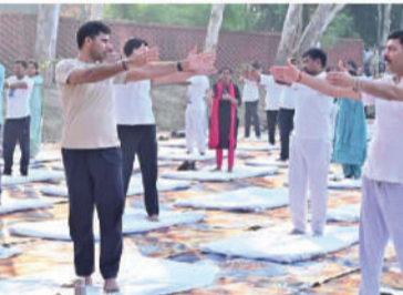
आजमगढ़, 15 जून (देवव्रत संवाद)। 12वें अंतरराष्ट्रीय योग दिवस के उपलक्ष्य में सोमवार को जनपद में योग सप्ताह का भव्य शुभारंभ हुआ।

पोस्टर, निबंध, भाषण, प्रश्नोत्तरी एवं रंगोली प्रतियोगिताएं आयोजित होंगी। प्रतियोगिताओं के विजेताओं को 21 हजार रुपये तक के पुरस्कार एवं प्रशस्ति पत्र प्रदान किए जाएंगे। 17 जून को 'आयुष ग्राम योग दिवस' के तहत ग्राम पंचायतों में योग सत्र एवं स्वास्थ्य परीक्षण शिविर लगाए जाएंगे। 18 जून को दिव्यांगजन, वंचित वर्ग, कैदियों, अनाथालयों और