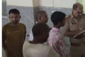
कोतवाली क्षेत्र के चमराडीह गांव स्थित निजामाबाद-फूलपुर मार्ग पर रविवार रात हुए सड़क हादसे में एक युवक की मौत हो गई।

फूलपुर, 15 जून (देवव्रत संवाद)। फूलपुर सड़क पर गिरकर गंभीर रूप से घायल हो