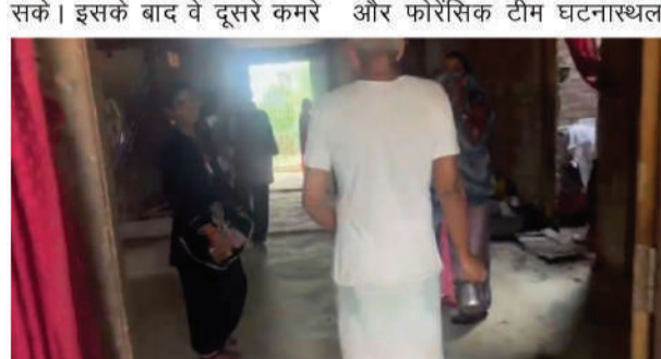
इसके बाद वे दूसरे कमरे और फॉरेंसिक टीम घटनास्थल पर पहुंची। पुलिस ने मौके का निरीक्षण कर आवश्यक साक्ष्य जुटाए और जांच शुरू कर दी।