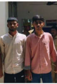
आरोपियों ने बताया कि घटना की रात वे मोटरसाइकिल से जा रहे थे। चौकिया गांव के पास एक युवक नशे की हालत में सड़क के बीच खड़ा था। हॉर्न बजाने के बावजूद रास्ते से न हटने पर विवाद हो गया। इसके बाद तीनों ने मिलकर युवक की लात-धूंसों, जूतों और चपलों से जमकर पिटाई कर दी। मारपीट के बाद युवक बेहोश हो गया, जिसे आरोपियों ने मृत समझ लिया। पहचान छिपाने के लिए उसके कपड़े उतारकर अपने साथ ले गए और बाद में रास्ते में फेंक दिए। पुलिस ने आरोपियों की निशानदेही पर घटना से संबंधित पैट, जूते, बेल्ट सहित अन्य सामान भी बरामद किया है। पुलिस ने बताया कि गिरफ्तार आरोपियों के खिलाफ दर्ज मुकदमे में अग्रिम विधिक कार्रवाई की जा रही है।