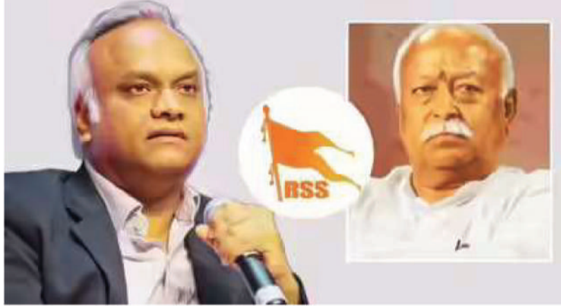
पृष्ठ हैं— आरएसएस का कानूनी दर्जा क्या है? यह सोसाइटी, ट्रस्ट, एनजीओ या किसी और रूप में रजिस्टर्ड क्यों नहीं है? संगठन

के पदाधिकारियों के नाम और अधिकृत प्रतिनिधि कौन हैं? चंदा, दान और आय के