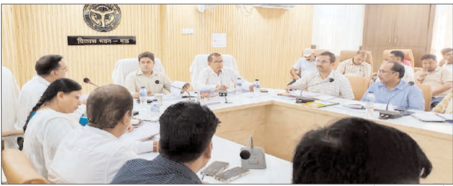
समयबद्ध एवं व्यवस्थित रूप से अभियान संचालित किया जा सके। उन्होंने वर्ष 2025 के वृक्षारोपण स्थलों को विभागवार पूर्ण विवरण उपलब्ध

बैठक के दौरान जिलाधिकारी ने वर्ष 2026 के वृक्षारोपण अभियान हेतु संबंधित विभागों को निर्देशित किया कि जिन विभागों ने अभी तक कार्य योजना तैयार कर उपलब्ध नहीं कराई है वे तत्काल कार्ययोजना तैयार कर उपलब्ध कराना सुनिश्चित करें, ताकि