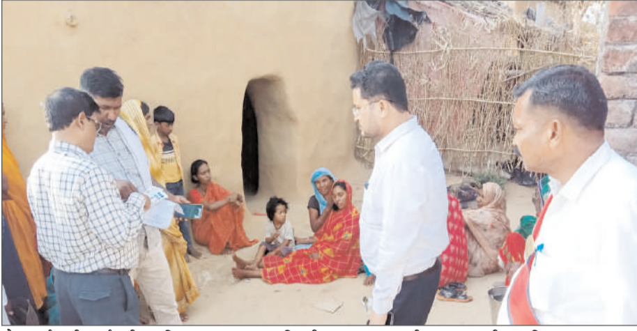
पोस्टमार्टम की कार्यवाही प्राथमिकता के आधार पर तत्काल पूर्ण कराते हुए

जिलाधिकारी ने सम्बन्धित उप जिलाधिकारियों को निर्देशित किया था कि आंधी व बारिश के कारण हुई जनहानि के मामलों में पंचनामा एवं