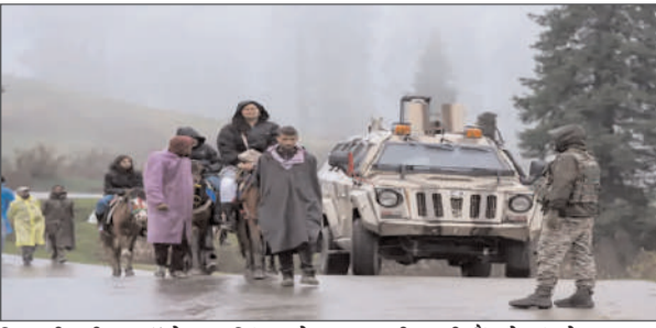
जिसकी थीम ऑपरेशन सिंदूर से जुड़ी है। सेना ने लिखा-कुछ हदें कभी नहीं लांधनी चाहिए। भारत कुछ नहीं भूला। जब इंसानियत की हदें

पहलगांम/नई दिल्ली, 21 अप्रैल (देवव्रत संवाद)। पहलगांम हमले की 22 अप्रैल को पहली बरसी है। कश्मीर के सभी टूरिस्ट स्पॉट्स पर सुरक्षा बढ़ा दी गई है। सुरक्षा एजेंसियों को अलर्ट पर रखा है। श्रीनगर से करीब 95 किमी दूर बैसरन घाटी में 22 अप्रैल 2025 को 26 लोगों को आतंकियों ने गोलीयां से भून दिया था। तब से यह घाटी बंद है। बैसरन घाटी में किसी को भी एक तय सीमा से आगे जाने की इजाजत नहीं है। पहलगांम के दूसरे टूरिस्ट स्पॉट बेताब वैली और चंदनवाड़ी तक जाने पर फिलहाल रोक नहीं है। पर्यटक पहले से 30-40% तक सिमट गए हैं। स्थानीय लोगों में गुस्सा है कि वैली को क्यों नहीं खोला जा रहा। आखिर उनका क्या कसूर है, जो आने वाले सैलानियों पर पाबंदियां लगा दीं। इधर, भारतीय सेना ने मंगलवार को अपने हैंडल पर एक पोस्ट किया है, जिसमें आतंकियों और उनके रहनुमाओं को चेतावनी दी है। पोस्ट के साथ जारी तस्वीर में सिंदूर और भारत का नक्शा दिखाया गया है, जिसकी थीम ऑपरेशन सिंदूर से जुड़ी है। सेना ने लिखा-कुछ हदें कभी नहीं लांधनी चाहिए। भारत कुछ नहीं भूला। जब इंसानियत की हदें