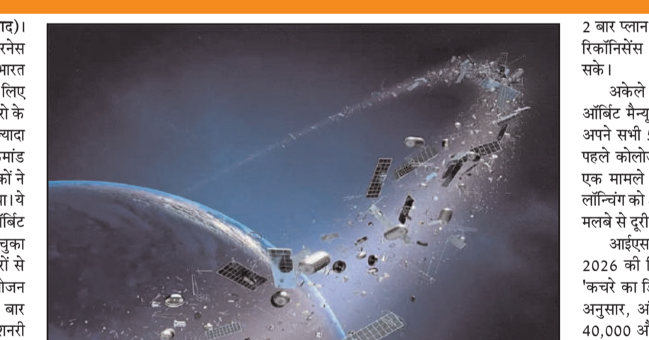
संभावित टकराव को टाला जाता है। पवित्र्य के जोखिम को देखते हुए, भी इसरो को 84 बार

नई दिल्ली, 17 अप्रैल (देवव्रत संवाद)। इसरो की इंडियन स्पेस सिचुएशनल अवेयरनेस रिपोर्ट-2025 के मुताबिक, पिछले साल भारत को अपने सैटेलाइट्स को सुरक्षित रखने के लिए बहुत सतर्कता बरतनी पड़ी। 2025 में इसरो के सैटेलाइट्स के लिए करीब डेढ़ लाख से ज्यादा अलर्ट जारी हुए। ये अलर्ट अमेरिकी स्पेस कमांड से मिले, जिनका विश्लेषण भारतीय वैज्ञानिकों ने अधिक सटीक ऑर्बिटल डेटा के साथ किया। ये आंकड़े साफ संकेत देते हैं कि लो-अर्थ ऑर्बिट अब खतरनाक रूप से भीड़भाड़ वाला हो चुका है। अंतरिक्ष में मलबे के टकराने के खतरों से बचने के लिए इसरो को 18 बार हॉकोलोजन अर्वाइडेंस मैनुवर्ल करना पड़ा। यह 14 बार छपड सैटेलाइट्स और 4 बार जियो स्टेशनरी सैटेलाइट्स के लिए किया गया। इन मैनुवर्ल में सैटेलाइट की गति और ऊंचाई में बदलाव कर